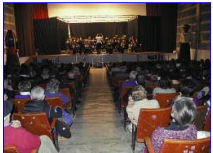
El pasado 30 de diciembre, la Banda Municipal dio su esperado Concierto de Navidad. Incluyó un amplio y bonito repertorio que hizo las delicias de un abarrotado cine.