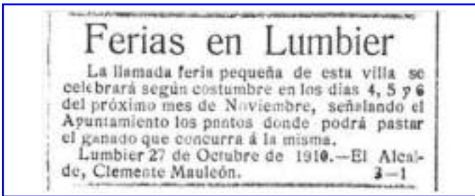
Anuncio de la feria pequeña en "El eco de navarra" (29-10-1910). A la derecha, anuncio de la principal en esa publicación (26-5-1912).