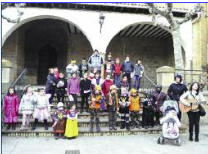
Los presentes en la tradicional Novena salieron a continuación a la calle para deleitar a los que por allí pasaban con unos villancicos con voces infantiles.