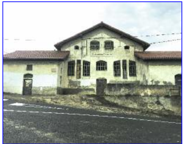
"Vivero de Empresas de la Comarca de Lumbier", proyecto presentado para su financiación.

La EDLP Cederna Garalur 2014-2020 se inscribe en la medida 19 "LEADER" del Programa de Desarrollo Rural de Navarra 2014-2020, y está cofinanciado por Gobierno de Navarra y por la