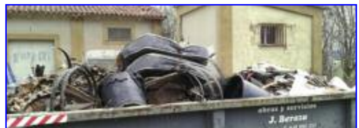
Ejemplo claro de lo NO se debe hacer, pero se hace...

Como norma general, los vecinos que deseen depositar tanto vertidos como restos de podas deberán llamar al teléfono 635 69 33 52 en horario de mañana.