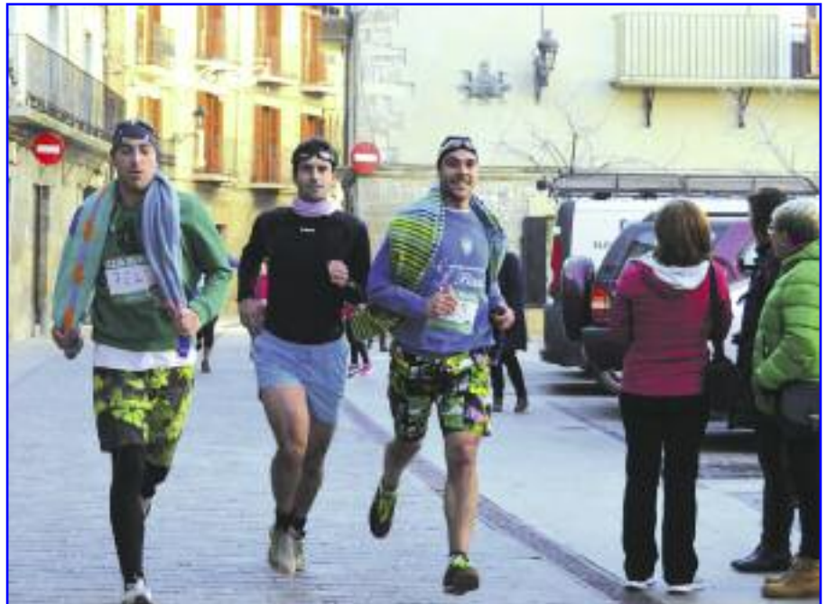
¿Qué mejor manera de acabar el año que haciendo un poco de deporte en la tradicional San Silvestre de Lumbier? Las pintas dan igual...