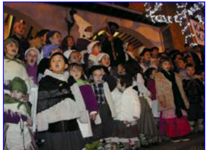
La expectación de los niños precedió, como no podía ser de otra manera, la llegada de Olentzero a Lumbier.