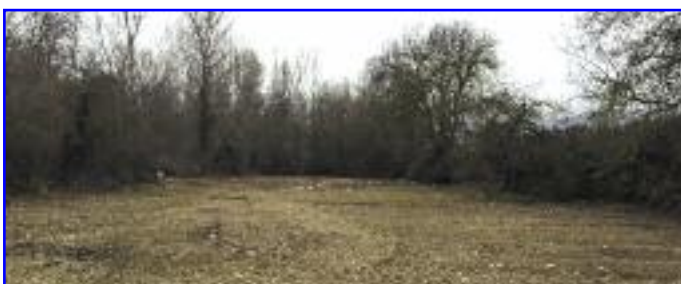
Terreno que se ha permutado para el arriendo a los vecinos.