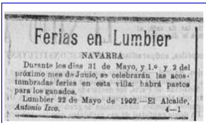
Anuncio de la feria principal en "El eco de navarra" (24-05-1902).