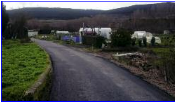
El acceso a las huertas de Bayacua, ahora asfaltado. Al lado, las papeleras en cuestión y el nuevo aspecto de una acera de la "Chantrea".