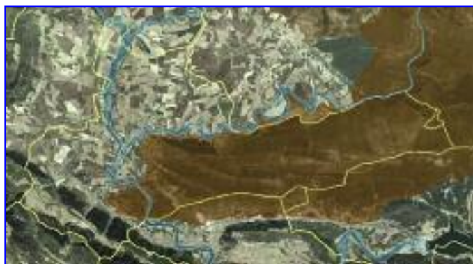
Espacios RN2000 en Lumbier. En azul: sistemas fluviales de los ríos Irati y Salazar. En marrón: LIC Sierra de Leire y Foz de Arbaiun (coincidente con la ZEPA).

Las regiones biogeográficas son áreas extensas que comparten aspectos ecológicos que las caracterizan y las dife-