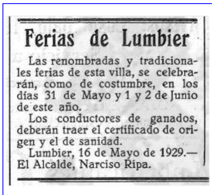
Anuncio de la feria principal en “La tierra” (órgano de Asociación Agricultores y Ganaderos del Alto Aragón). 22-05-1929.

La feria de 1898 contó con novedades. “El Eco de Navarra” del 4 de junio de ese año nos cuenta que, además de buen tiempo y abundante ganado, llamó ante todo la atención la instalación de un fonógrafo que dejó boquia-