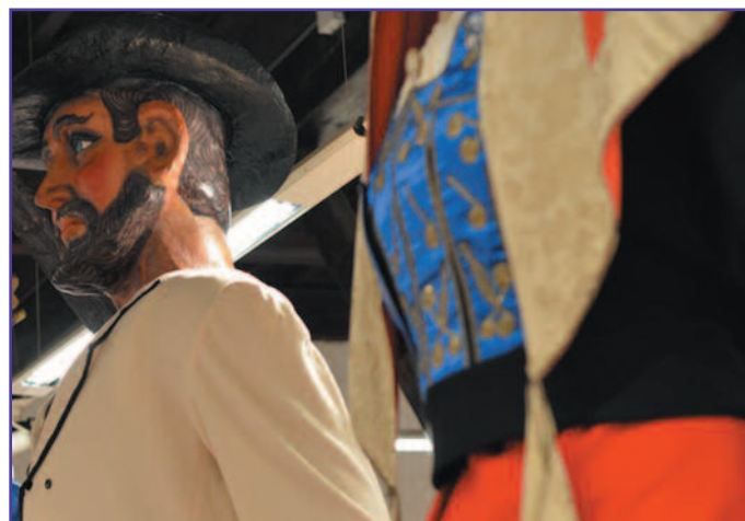
El Ayuntamiento de Lumbier pondrá a la venta las figuras de sus gigantes roncaleses en versión goma, para disfrute de los más pequeños. Se avisará cuando se hayan fabricado.