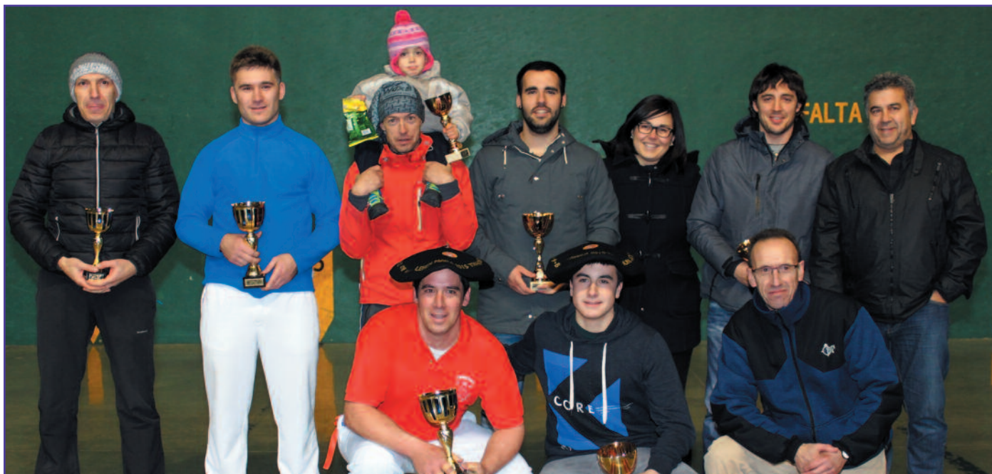
Foto de grupo de la entrega de trofeos del torneo local de pelota.

Gracias a la participación de nuestros pelotaris amateurs los aficionados a la pelota de Lumbier pueden disfrutar de este deporte desde noviembre hasta mayo. ¡Que dure!