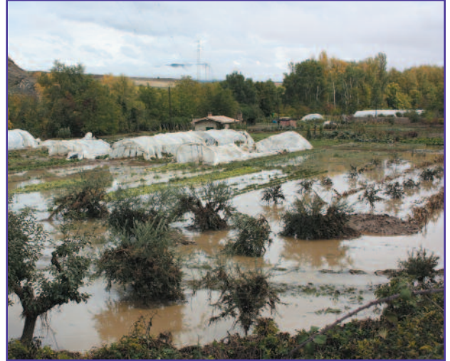
Como se observa en las imágenes de archivo, las intensas lluvias de octubre de 2012 produjeron destrozos en caminos e inundaciones en las huertas de Lumbier.

En el caso de Lumbier, que es el que nos interesa, se adjudicaron, el pasado 10 de septiembre de 2014, 51.900 euros (IVA incluido). La Administración Central se hará cargo del 50% de esta