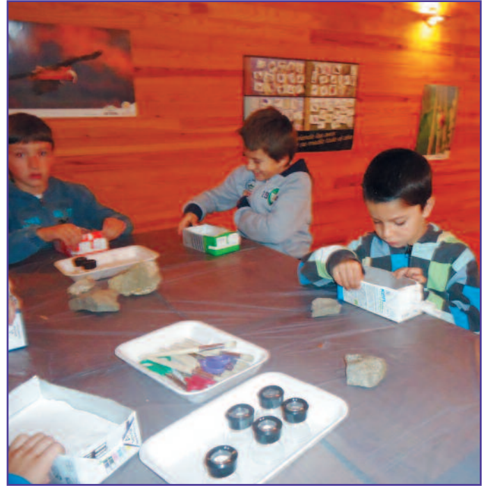
A la izquierda, alumnos del Colegio Público San Juan, que este trimestre han trabajado el consumo energético. Al lado, el taller de dinosaurios y fósiles realizado por los alumnos de primer ciclo de Arangoiti Ikastola.

En total, han sido más de 1.000 escolares los que han participado en la campaña escolar de este otoño en el Centro de Interpretación de las Foces de Lumbier.