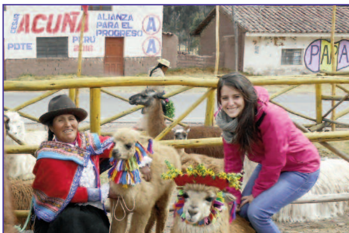
En el Valle Sagrado de los Incas.