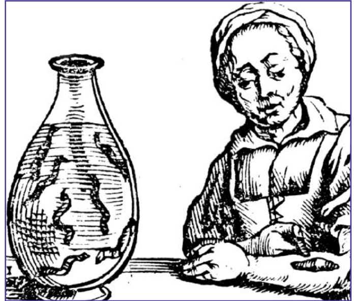
Mujer aplicándose unas sanguijuelas para reducir el exceso de sangre. Las sanguijuelas se almacenaban en botellas diseñadas para tal fin.

6ª.- Este convenio no tendrá fuerza ni valor alguno hasta tanto que la