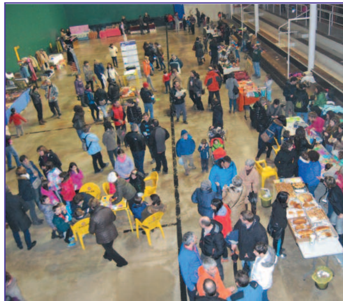
Imagen general del mercadillo celebrado en Lumbier el pasado 27 de diciembre.

Se aprovecha para recordar que ANFAS Sangüesa da servicio a una zona muy amplia y que actualmente son 80 los usuarios, siendo de nuestra localidad 7 personas las que participan en los diferentes servicios que se prestan.