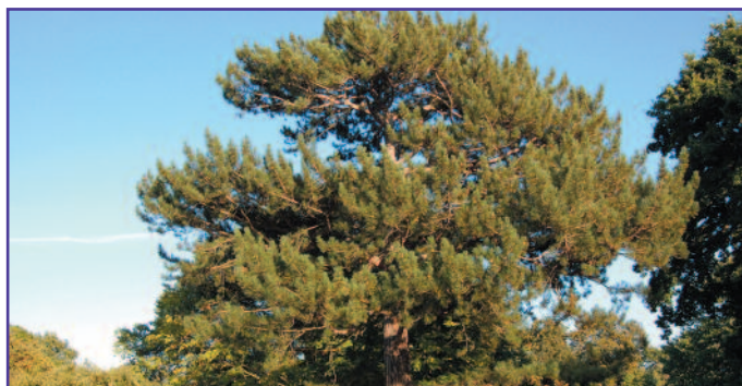
En la imagen, un ejemplar de pino laricio como el subastado en el término lumbierino de Olaz.

Lógicamente, y tal y como se acordó con el Servicio de Montes del Gobierno de Navarra, parte de los ingresos obtenidos con la venta serán destinados a la replantación del pinar derribado.