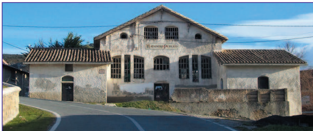
Arriba, una zona de Avenida Diputación, que verá renovada sus redes. Debajo, el Matadero.