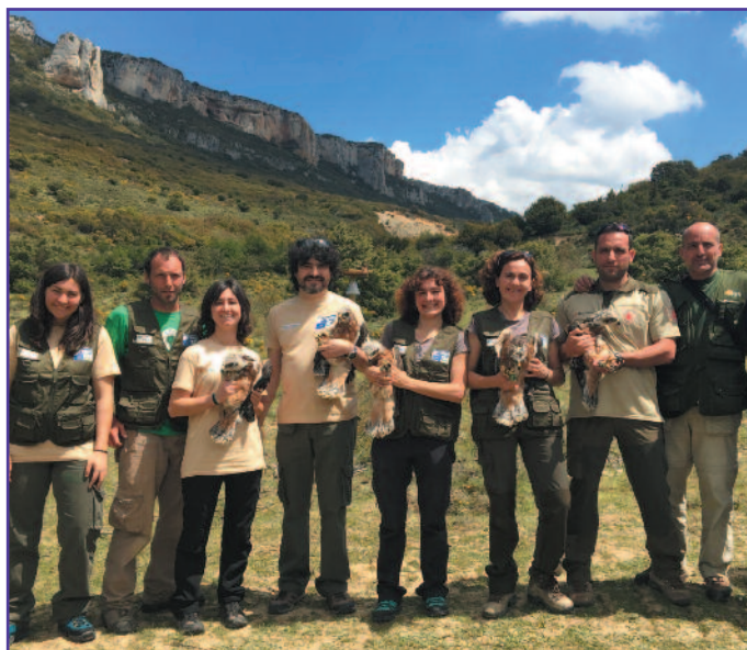
Momento de liberación de Arrangoiti, Júpiter, Rapacero, Archiene y Vercors con técnicos del Servicio de Biodiversidad del Gobierno de Navarra, Gestión Ambiental de Navarra, asistencia de Itziar Almárcegui, Guarderío Forestal de Navarra, GREFA y alumnos en prácticas de la UPV/EHU y de la UNAV.

Sobreviven 3 de los 5 pollos que se soltaron en 2015 en Lumbier. El futuro depende de que estos ejemplares, ya adultos, vuelvan a criar en los cortados de la Sierra de Leire