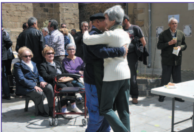
Hubo momentos para el baile y también para visitar un antiguo horno de pan.

Gure herriko produktuak ezagutzera eman nahi genituen eta herria animatu. Olioaz gain, baita beste produktu batzuk ere, hala nola, aguardienta edo ogia... Egunari Ilunberriko izaera eman nahi diogu, gauza berriak egin, olibadiak bisitatu... Festa eguna izan dadila. Herri bakoitzak bere izaera du. Ilunberri, esaterako, oso gustukoa dugu musika.