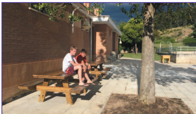
Espacio de merenderos ampliado, y, al lado, detalle del parking de la Foz.

centro histórico de Lumbier. Por ese motivo, el Ayuntamiento ha emprendido una serie de acciones para paliar, en la medida de lo posible, este problema.