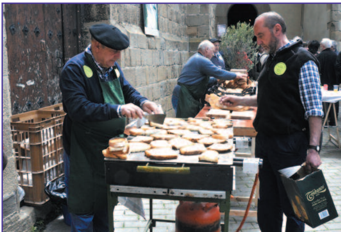
Preparación de tostadas y, al lado, la Plaza de Santa María a rebosar.