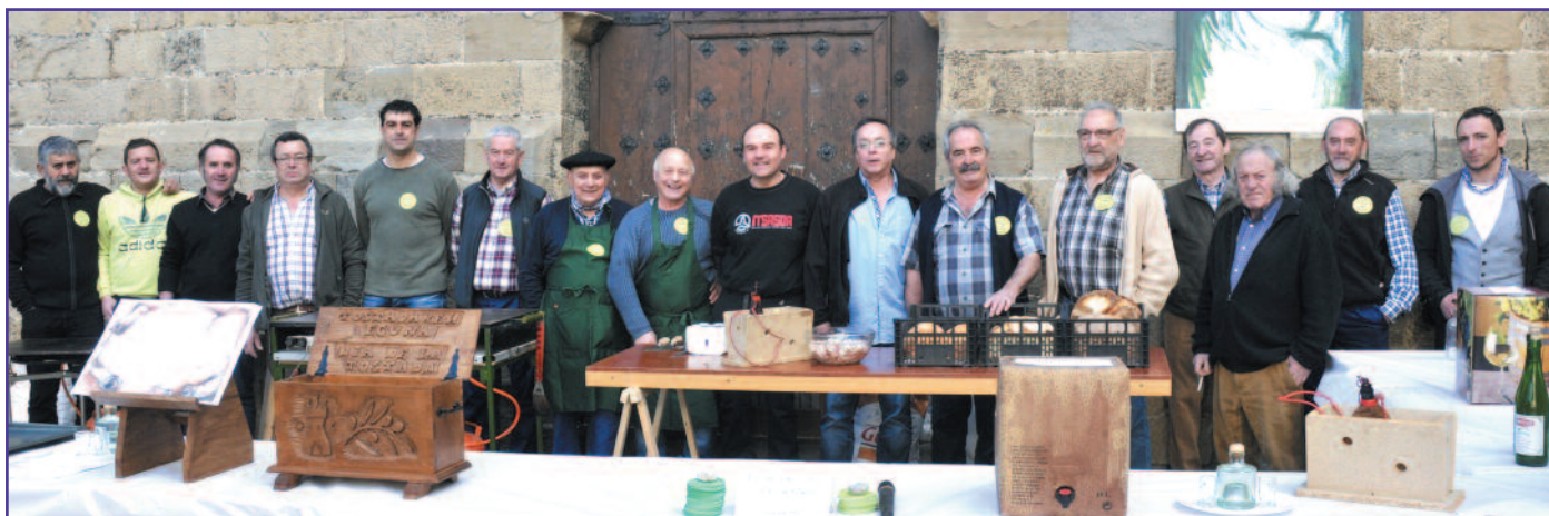
Foto de grupo de los organizadores del Día de la Tostada en Lumbier.

El pasado 17 de abril, la localidad acogió la tercera edición de esta jornada promovida por un grupo de amigos que quieren “dar a conocer los productos locales y animar el cotarro”