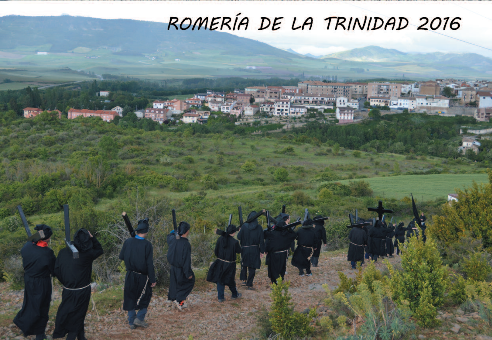
ROMERÍA DE LA TRINIDAD 2016