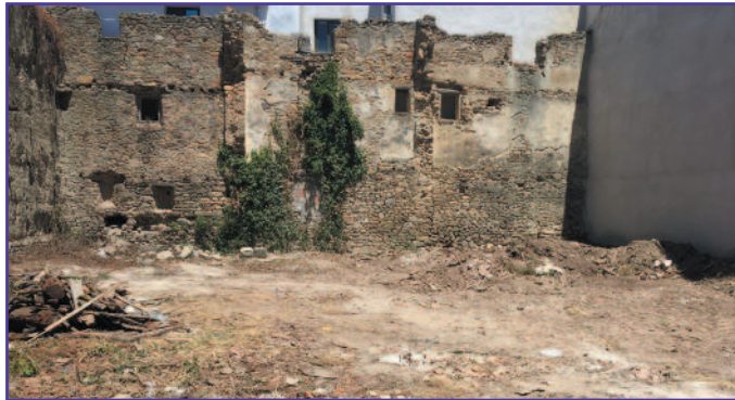
Solar de la Calle San Juan que se va a habilitar como aparcamiento.

De todos es sabida la falta de plazas para aparcar en el