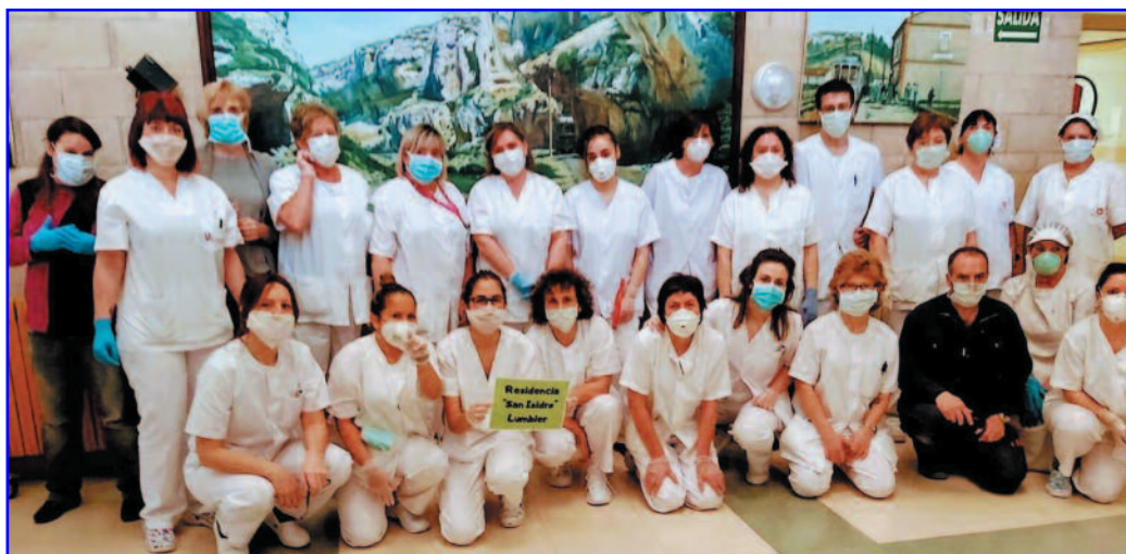
Parte de la plantilla de la Residencia de Ancianos San Isidro (Lumbier).

Aparte de lo comentado anteriormente como medidas de prevención dentro de la casa se tomaron otras medidas de cara al exterior.