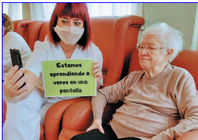
Videoconferencia durante los días de confinamiento en San Isidro.

Aquí en “San Isidro” no lo vivimos como algo caótico. Trabajamos lo más rápido posible ya que nuestra obligación como equipo de dirección es serenar, analizar, plani-