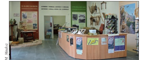
Área de recepción del Centro de Interpretación de las Foces

La villa de Lumbier cuenta con una buena infraestructura turística y comercial: camping, hotel, apartamentos, restaurantes, bares, oficina de información... La visita de su apretado casco urbano depara gratas sorpresas, entre las que se pueden encontrar varios monumentos de interés.