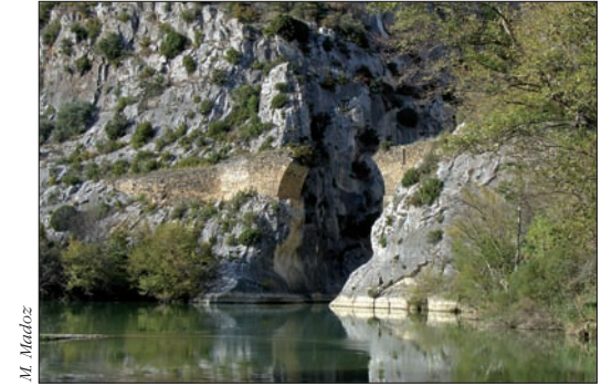
Puente del Diablo

► Puente del Diablo. A la salida de la Foz por el sur, después de pasar el segundo túnel, se encuentran los vestigios de un vertiginoso puente datado del siglo XVI. Fue destruido en 1812 durante la Guerra de la Independencia. Es conocido también por Puente de la Foz o Puente de Jesús. ¡Precaución, acceso peligroso al borde del puente!