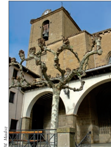
Iglesia de La Asunción