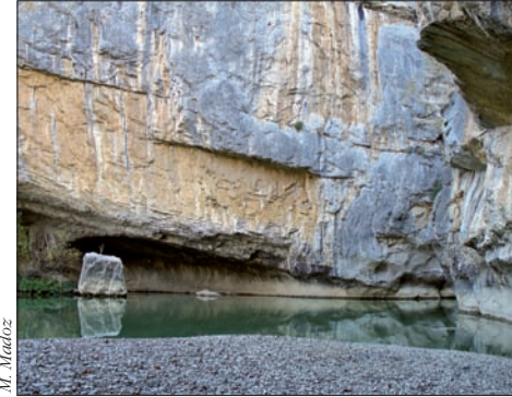
Foz de Lumbier