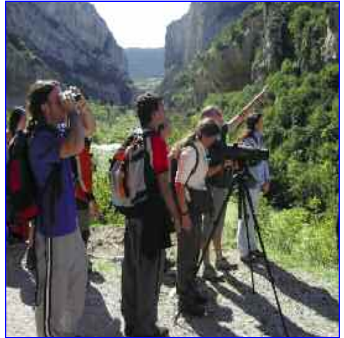
Observación de aves en la Foz.

En resumen, la implantación del PSTD y la recuperación Camino Natural del Irati forman la tormenta perfecta como palanca para el desarrollo turístico de Lumbier y su entorno.