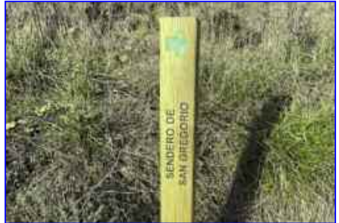
Arriba, camposanto encontrado en los alrededores de la Torre de San Gregorio. En las otras imágenes, varios detalles del ya acondicionado Sendero del mismo nombre.

ción del sendero que enlaza el núcleo urbano de Lumbier y el Camino del Iturbero (habitualmente utilizado para llegar a la Vía Verde de Irati) con la Torre de San Gregorio.