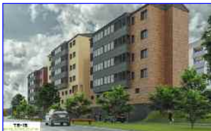
Propuesta ganadora para Cuesta del Hospital 4, 6 y 8.

tica de edificios construidos. En cuanto a las ayudas existentes para las envolventes térmicas, el BON publicado el pasado 5 de enero recoge la modificación de ayudas del PREE 5000 , destinadas a municipios con menos de 5.000 habitantes como Lumbier. La modificación supone un aumento de dichas ayudas, pudiendo alcanzar hasta 15.300€ por vivienda, además de disminuir los requisitos para adaptarse mejor a las tipologías de casas del ámbito rural de Navarra. De este modo, gracias a su compatibilidad con las ayudas a la rehabilitación protegida