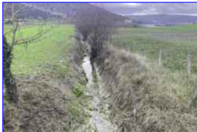
A la izquierda, uno de los caminos afectados por las fuertes lluvias que se van a arreglar. Al lado, la acequia del Prado, ya limpia.

Durante el pasado diciembre de 2021 se produjeron en Navarra precipitaciones muy por encima de lo normal, que supusieron, entre otras, afectaciones importantes a infraestructuras públicas y privadas, pérdidas en explotaciones agrarias y ganaderas, daños al medio natural, así como a bienes de naturaleza pública y privada.