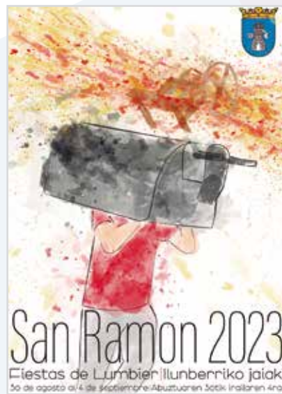
1 er Premio adultos