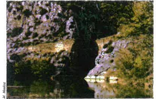
Puente del Diablo

► Puente del Diablo. A la salida de la Foz por el sur, después de pasar el segundo túnel, se encuentran los vestigios de un vertiginoso puente, anclado en las rocas de los dos extremos de la garganta. Los restos datan del siglo XVI. Fue destruido en 1312 durante la Guerra de la Independencia. Es conocido también por Puente de la Foz o Puente de Jesús.