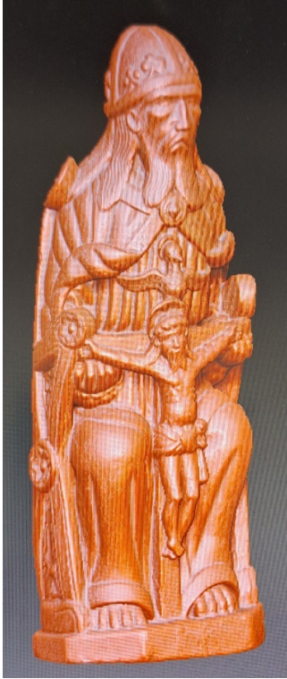
Archivo virtual en 3D preparado para imprimir.