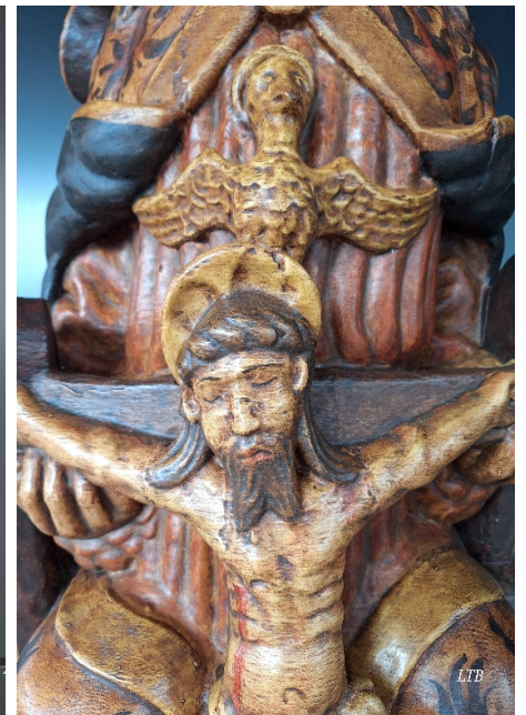
Imagen policromada y detalles.