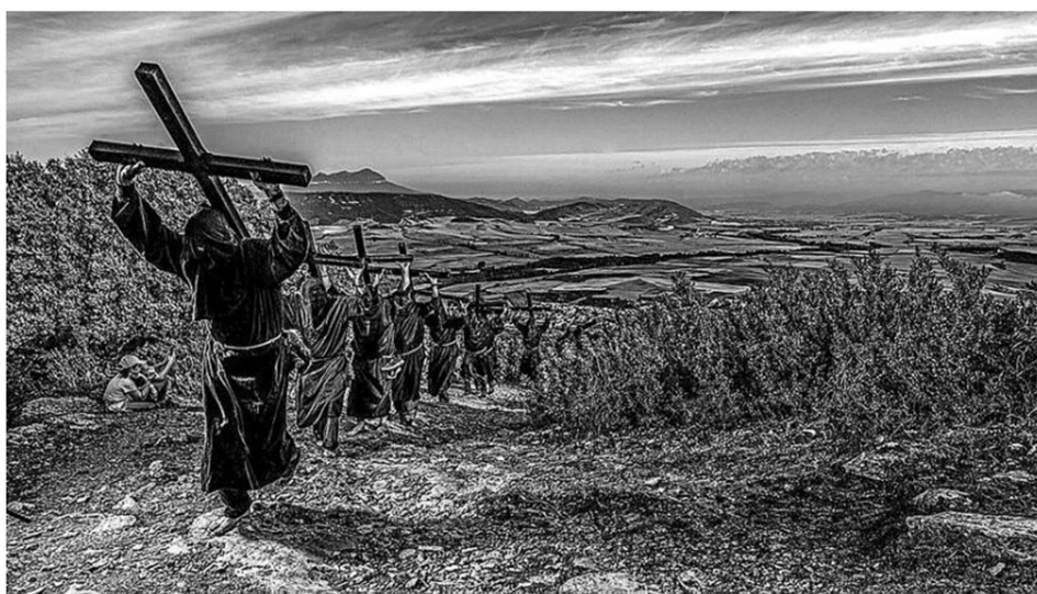
Romeros a la Trinidad. "Lumbier asciende a la Trinidad"

La original es una talla realizada en madera de nogal de 120 centímetros de altura y 48 cm de anchura que, aunque fue catalogada en su tiempo como de estilo prerrománico o como más tardío gótico, lo cierto es que, según una tasación especializada en arte y encargada por el Ayuntamiento de Lumbier la