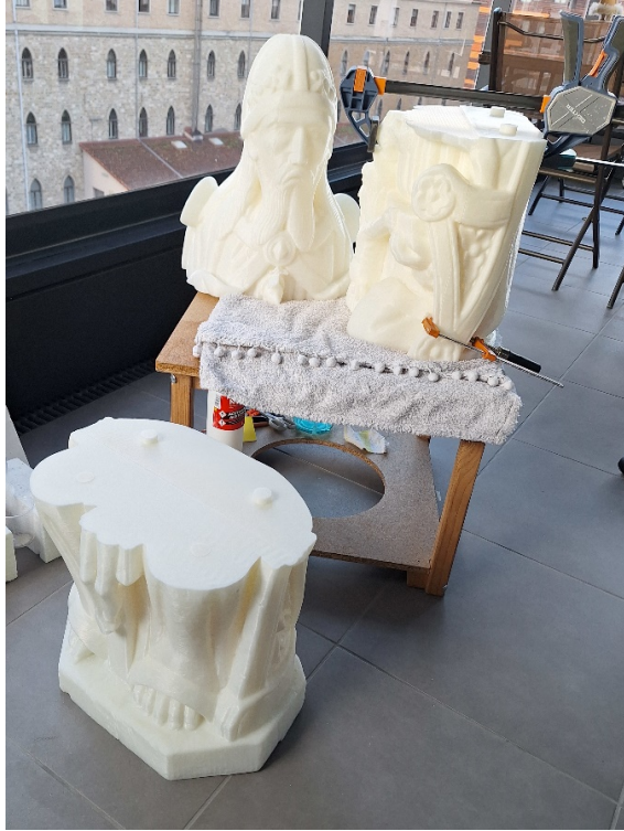
Piezas Impresas en ABS (realizadas por Íñigo Ros - Cavilla ICT SLU). Proceso de montaje e imagen preparada para policromar.