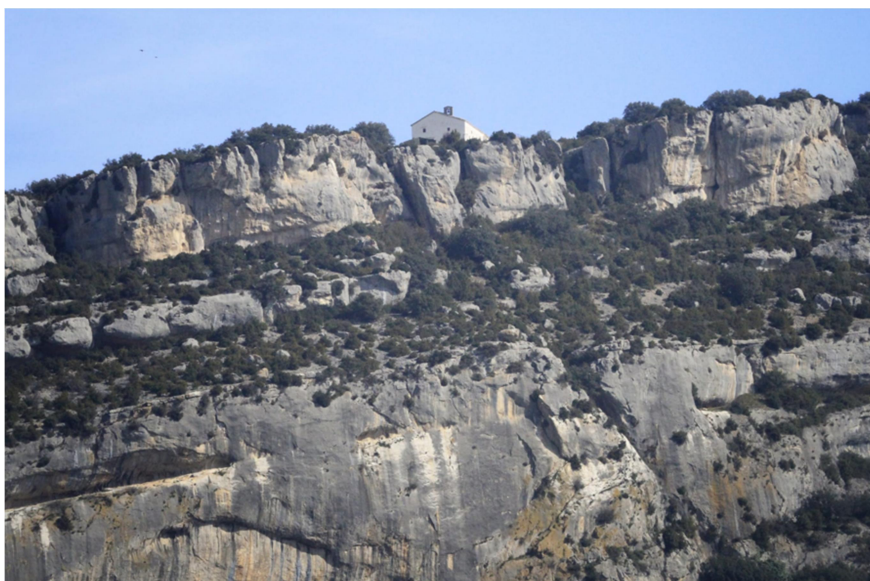
Ermita de la Trinidad sobre las estribaciones de la Sierra de Leire

La Ermita de la Trinidad de Lumbier en la que se celebra una de las más célebres romerías penitenciales de Navarra albergó históricamente una talla de la Santísima Trinidad hasta la tercera guerra carlista en el S. XIX. Acertadamente la talla fue evacuada al pueblo de Lumbier por su valor patrimonial y sentimental. Así estuvo recogida en una casa privada hasta que en los años 60 fue adquirida por un particular por lo que la escultura salió de Lumbier, aunque no de Navarra.