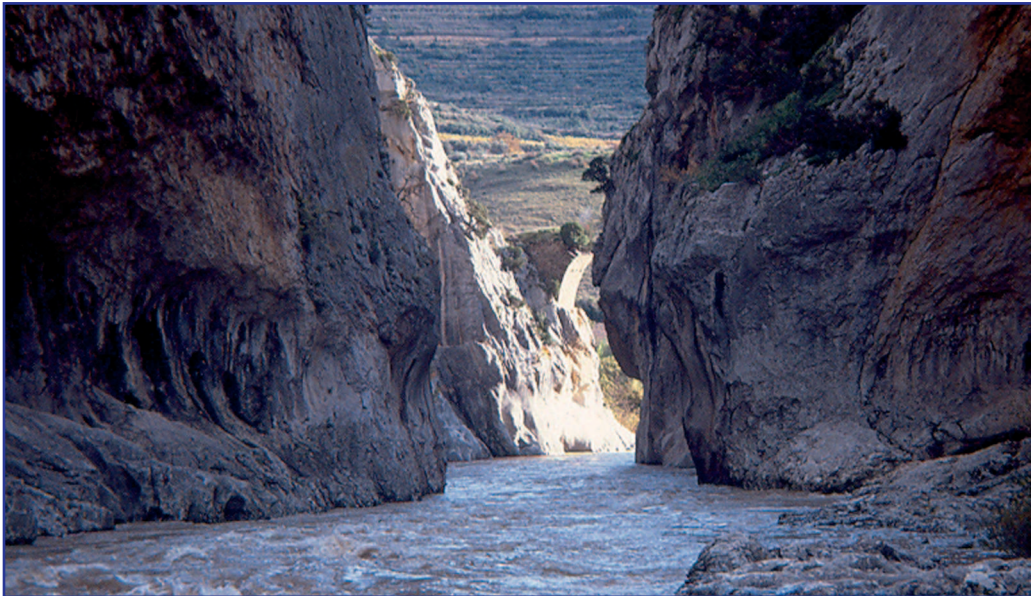
Interior de la Foz de Lumbier. Al fondo, bañado por el sol, el Puente del Diablo o de Jesús.

un paisaje delicioso, y en él se erguía majestuoso un encantador palacio (...). Era nada menos que la residencia de la princesa Magdalena, joven tan bella como buena (...). La princesa venía sufriendo de tiempo atrás una grave dolencia de estómago y riñones (...).