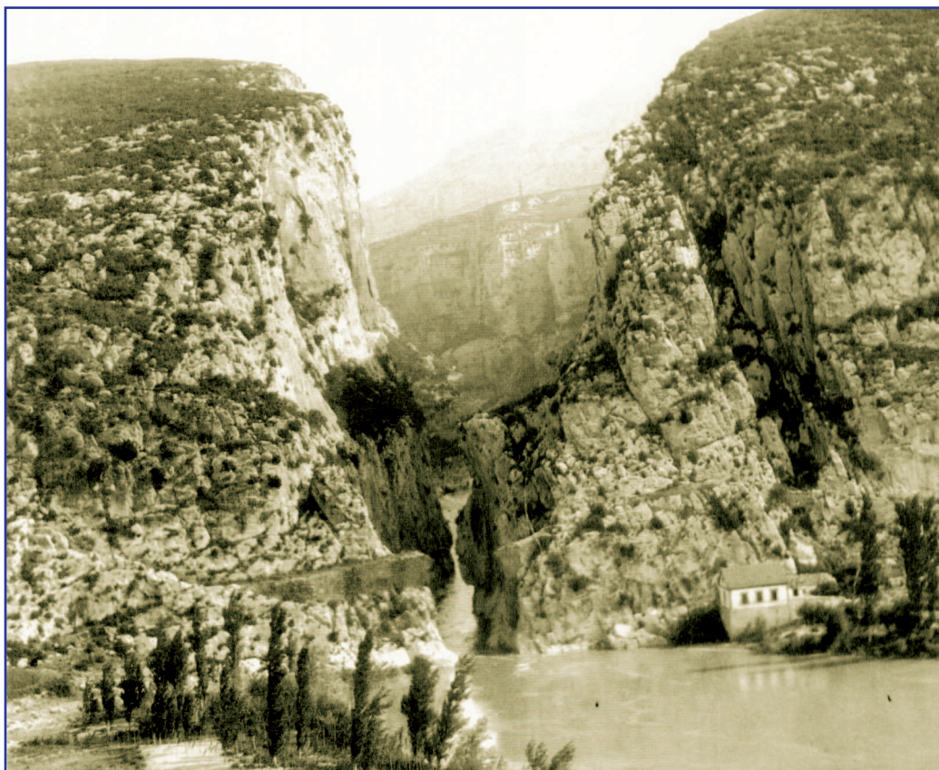
Imagen antigua del paraje donde se erigió el puente antes de su destrucción.

Pudo haberse construido sobre las ruinas de algún otro puente romano (como se sabe, en la zona han aparecido las ruinas de una villa romana), y parece claro que se se levantó siguiendo la ley del mínimo esfuerzo, ya que en este lugar del camino es donde el río Irati ofrece menos anchura: ocho metros, frente a los más de cien que tenía el puente de Sangüesa sobre el Aragón.